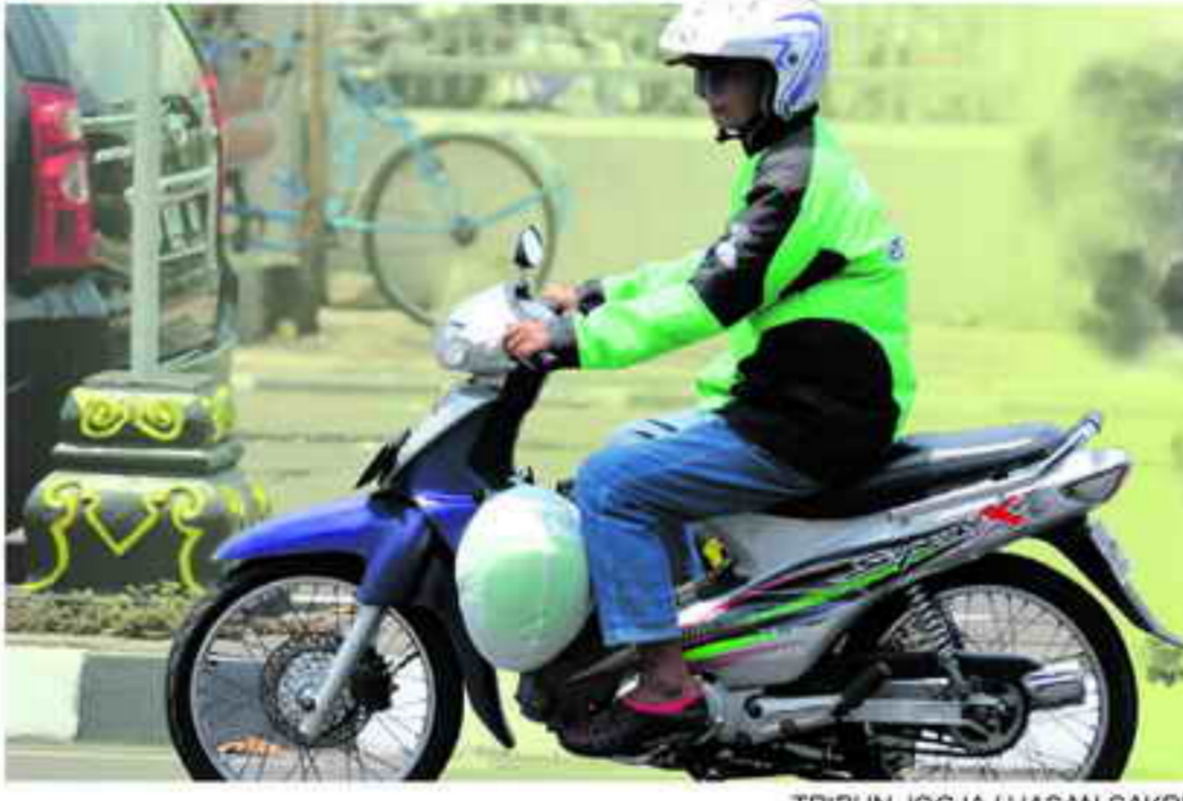
MODERN - Pengemudi Gojek mulai melayani pelanggan, Senin (16/11). Raksasa ojek online tersebut mulai Senin kemarin mulai beroperasi di Yogya.

MESKI aplikasi ojek online Gojek sudah mulai masuk ke Yogyakarta sejak Senin (16/11), namun pihak Dinas Perhubungan DIY justru mengaku belum mengetahuinya. "Belum, belum ada apa-apa. Sampai saat ini kita belum ada pemberitahuan belum ada undangan," ujar Kepala Dishub DIY, Sigit Haryanta.